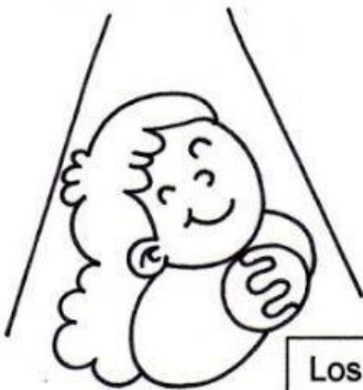
Los que tienen