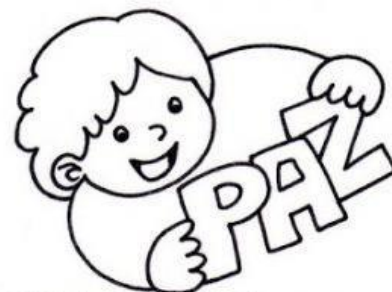
Los que trabajan