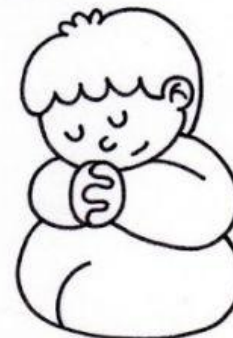
Los que son