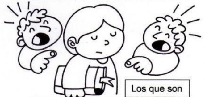
Los que son