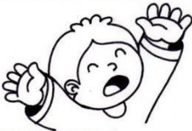
Los que buscan