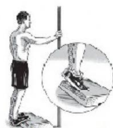
rotación de muñeca flexión de tobillos