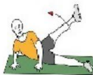
apertura de cadera giro de cintura