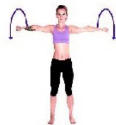
rotación de hombros flexión de cuello