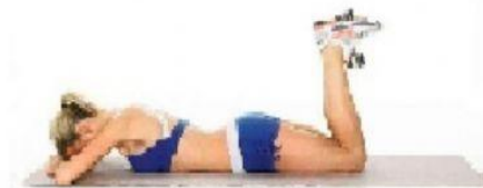
flexión de rodillas flexión de cadera