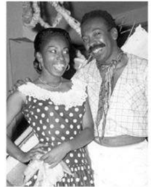
HERMANOS SANTA CRUZ