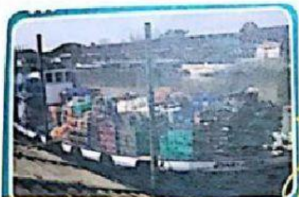
Lancha - almacén en el Delta.