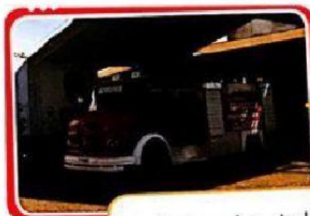
Autobomba de los bomberos de Puerto Iguazú, Misiones.