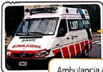
Ambulancia del sistema médico estatal.