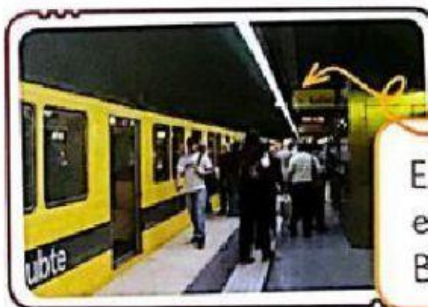
El subterráneo en la ciudad de Buenos Aires.