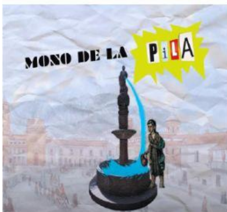
Imagen que representa la fundación de Bogotá.

Indígenas que vivieron en lo que hoy es Cundinamarca y Boyacá.