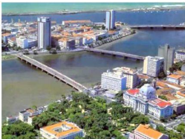
Cidade do Recife