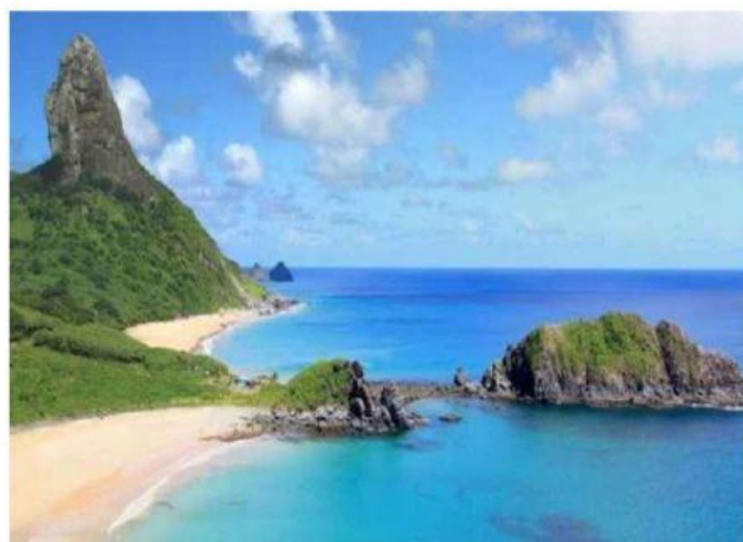
Fernando de Noronha

1) Observe as imagens e descreva as semelhanças e diferenças apresentadas: