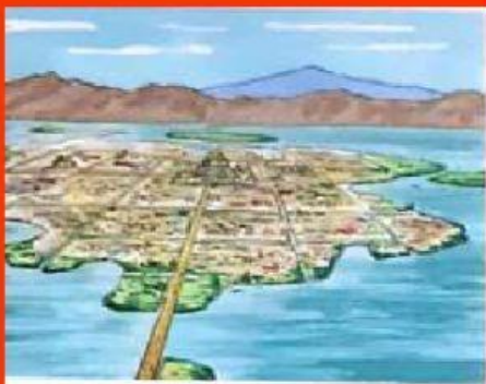
▲ Esta ilustración muestra cómo era la ciudad de Tenochtitlán.

Los aztecas levantaron su ciudad capital, Tenochtitlán (hoy es la ciudad de México), sobre los islotes de un lago. Por eso tuvieron que construir calles y puentes para conectar los islotes con la tierra firme. En esta ciudad, como en otras importantes, construyeron templos en forma de pirámide y edificios públicos. También había un gran mercado por el que circulaban miles de personas a diario. Allí compraban y vendían maíz, chocolate y tejidos, entre otros productos.