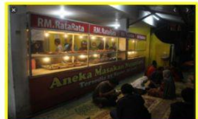
Kegiatan ekonomi produksi