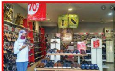
Kegiatan ekonomi produksi