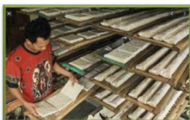
Kegiatan ekonomi produksi

I. Cermati gambar dan bacalah teks di bawah ini dengan seksama.