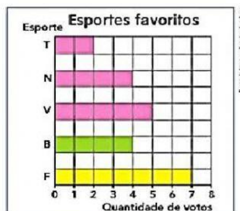
Tabela e gráfico elaborados para fins didáticos.