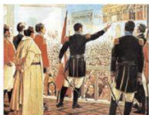
La independencia del Perú.