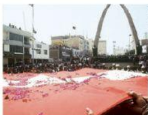
Un hecho histórico ocurrido en su región.