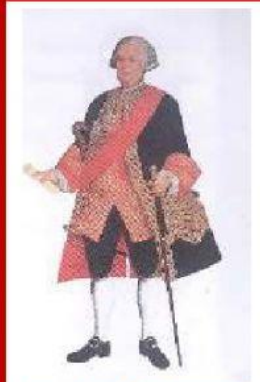
Los altos funcionarios de gobierno, e incluso sus asistentes, eran casi siempre españoles

Pero estas medidas no fueron bien recibidas por todos. ¿Por qué? Los españoles defendían el comercio exclusivo con España y se quejaban de que el ingreso masivo de productos haría bajar los precios y las ganancias comerciales.