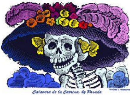
Calaveritas de azúcar