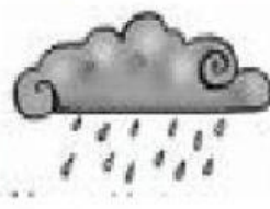
nube con agua