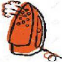
plancha de vapor