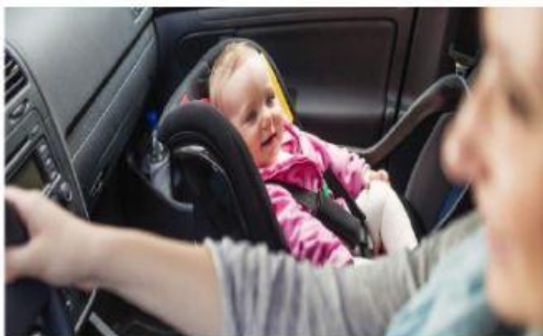
Un menor de edad en la parte delantera del auto.