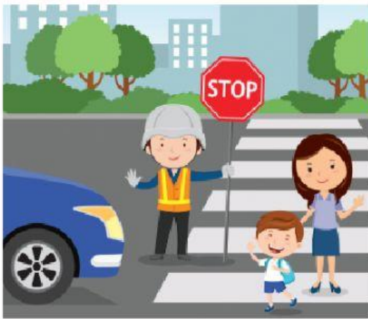
Utilizar el paso peatonal.