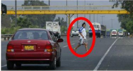
Cruzar por media calle.