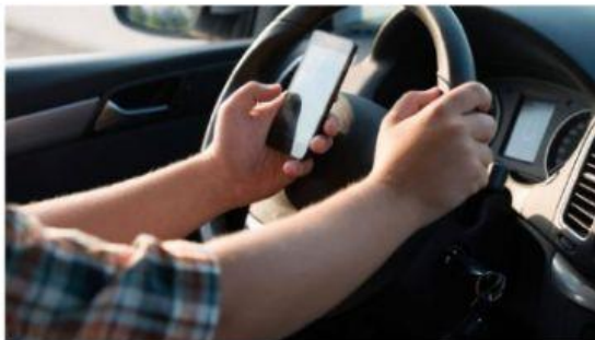
Usar el celular cuando vamos manejando.