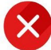
Bajarse del carro en la calle.