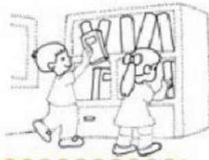
Arreglar el salón