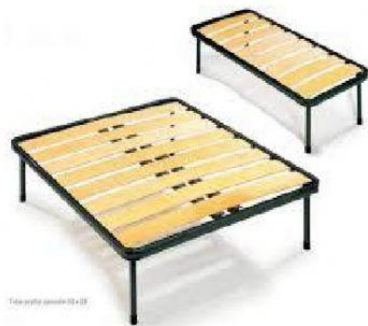
Tela pręta sprężyna 52 x 18