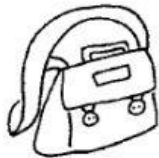
School bag [ eskiul bag ] Maleta