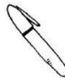
Pen [ pen ] Esfero