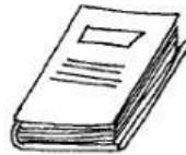
Book [ búuk ] Libro