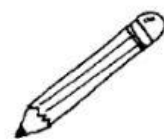
Pencil [ pénsol ] Lápiz