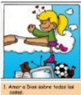
1. Amar a Dios sobre todas las cosas.