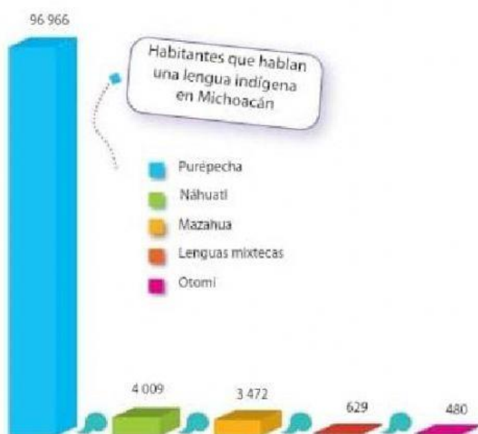
Gráfica de habitantes que hablan una lengua indígena en Michoacán.

La información de la tabla también se puede representar en una gráfica: