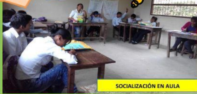
SOCIALIZACIÓN EN AULA