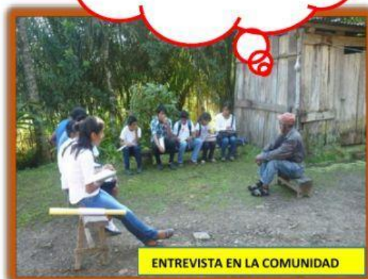
ENTREVISTA EN LA COMUNIDAD

Estudiantes, hay que saber administrar bien, el poco dinero que tenemos"