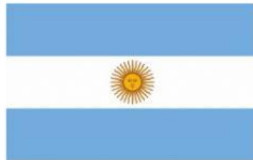
ARGENTINA (Virreinato del Río de la Plata)