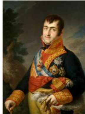
Rey Fernando VII