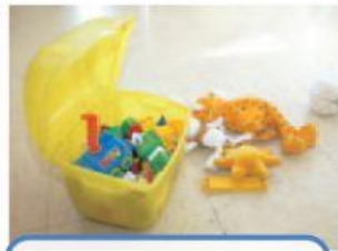
Guardar los juguetes.