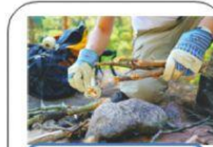
Hacer una fogata.

4. ¿Cuál de las fotografías muestra un ejemplo de responsabilidad de un niño o niña de tu edad?