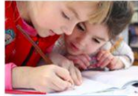
Hacer las tareas.