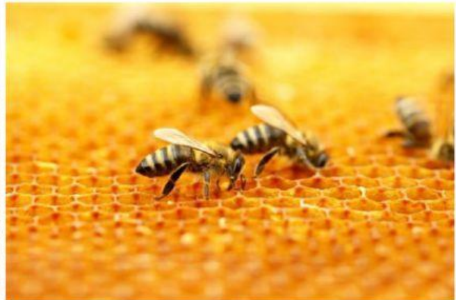
FUENTE DE MATERIAS PRIMAS