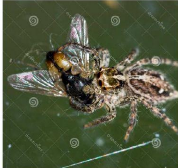
CONTROLAN LA POBLACIÓN