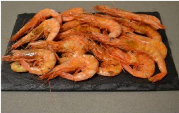
SIRVEN DE ALIMENTO