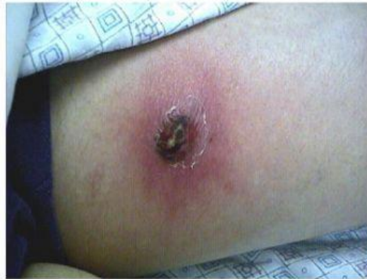
PICADURAS TRANSMISORAS DE ENFERMEDADES