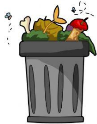
b a s u r e r o