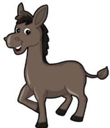
b u r r o