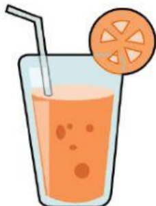
j u g o