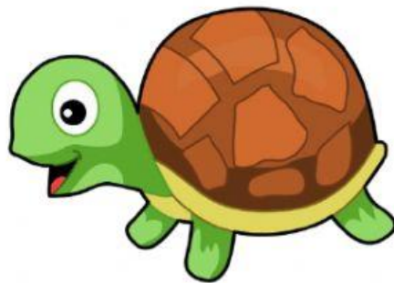
t o r t u g a