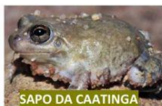
SAPO DA CAATINGA