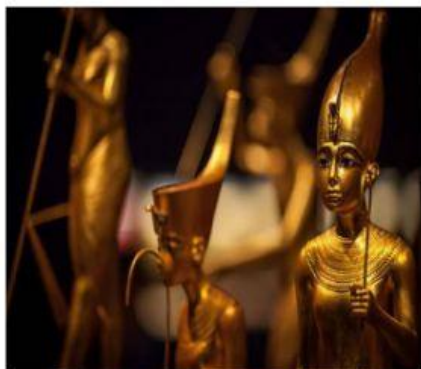
Esculturas de oro macizo

El museo alberga, desde el descubrimiento de la tumba del famoso faraón en 1922, las piezas encontradas en su tumba. Se trata de un tesoro que conformaba el ajuar del faraón para su vida posterior, tal como creían los antiguos egipcios. La pieza robada no ha sido rebelada por las autoridades del museo por seguridad de la misma.