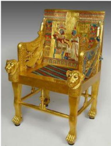
Trono del faraón bañado en oro

Estaremos muy pendientes de las investigaciones que próximamente les iremos detallando.