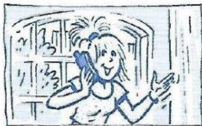
Sue a friend.