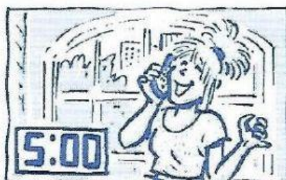
She a friend 5.00.