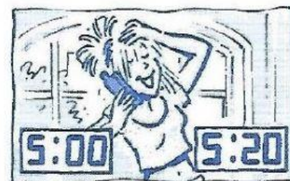
She a friend 20 minutes.