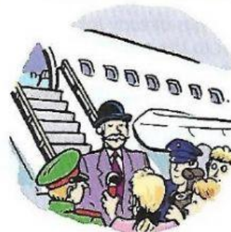
5. The Prime Minister.