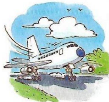
8. A plane