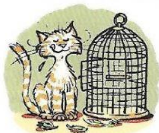
1. The cat