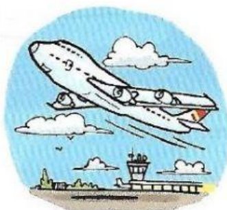
6. A Boeing