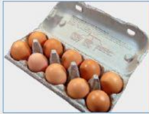
Huevos de gallina