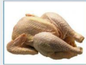
Carne de pollo

Es el ave más numerosa del mundo. Hay más de 16.000.000.000 (dieciséis mil millones).