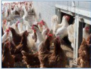
Granja de gallinas

Los humanos crían a las gallinas y pollos en granjas para alimentarse de sus huevos y su carne.