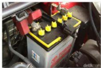
Gambar (a) Air aki

Beberapa senyawa asam dan basa memang dapat dibedakan berdasarkan rasanya dan digunakan sebagai bahan tambahan makanan, seperti jeruk dan pengembang kue atau natrium bikarbonat. Namun, tidak semua senyawa asam dan basa dapat dirasakan atau disentuh. Contohnya dalam kehidupan sehari-hari adalah air aki (gambar a) yang mengandung asam sulfat dan pemutih pakaian (gambar b) yang mengandung natrium hipoklorit. Air aki tidak dapat disentuh karena bersifat korosif yang dapat menyebabkan luka bakar. Begitupun pemutih pakaian yang bersifat racun dan berbahaya jika sampai tertelan.