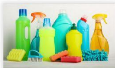
Gambar 1. Produk kebersihan

Dapatkah kalian membedakan produk mana yang merupakan asam dan basa tanpa menyentuh atau mencicipinya?