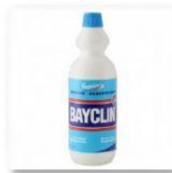
Gambar (b) Pemutih pakaian