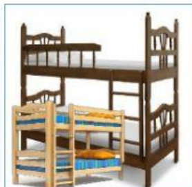
5 bunk beds