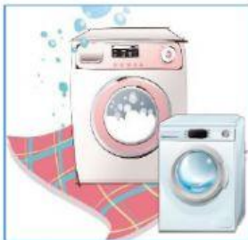
1 washing machines