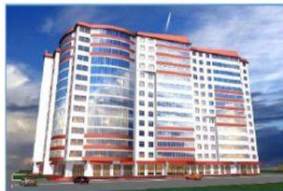
2 block of flats