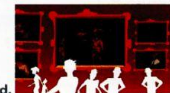
d. le musée