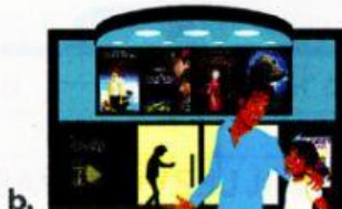
b. le cinéma