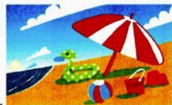
e. la plage