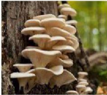
Jamur Tiram ( Volvariella volvacea )

3. Fungi diklassifikasikan berdasarkan spora seksualnya. Nah sekarang...cocokkan nama Divisi pada Kingdom Fungi dengan gambar masing-masing contoh jamur yang mewakili divisio tersebut dengan cara menarik kotak berisi nama divisio ke bawah gambar contoh jamur dari masing-masing divisio!