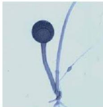
Jamur Tempe ( Rhizopus sp.)