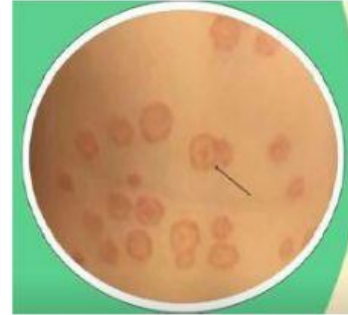
Tinea versicolor (Jamur pada kulit/panu)