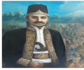
S. Ageng Tirtayasa