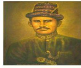
S. Iskandar Muda