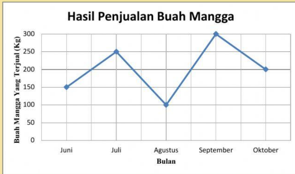
Diagram berikut merupakan data banyaknya buah mangga milik Pak Yanto yang terjual dalam kurun waktu 5 bulan yaitu pada bulan Juni, Juli, Agustus, September dan Oktober.

Berdasarkan diagram tersebut, coba kamu analisis :