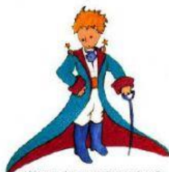
Ahí tienen el mejor retrato que más tarde logré hacer de él.

Ahí tienen el mejor retrato que más tarde logré hacer de él, aunque mi dibujo, ciertamente es menos encantador que el modelo. Pero no es mía la culpa. Las personas grandes me desanimaron de mi carrera de pintor a la edad de seis años y no había aprendido a dibujar otra cosa que boas cerradas y boas abiertas.