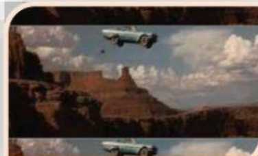
Thelma and Louise