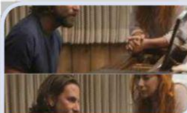
A star is born