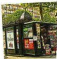
UN K IOSQUE