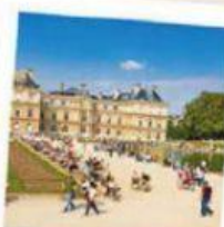
LE J ARDIN DU LUXEMBOURG