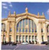
LA G ARE DU NORD