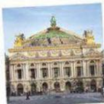
L' O PÉRA GARNIER