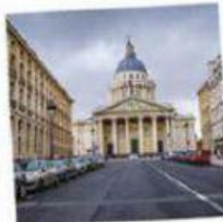
LE P ANTHÉON