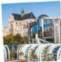
LES H ALLES