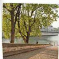
LES Q UAIS DE SEINE