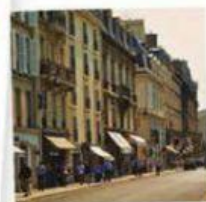
LE F AUBOURG- SAINT-HONORÉ