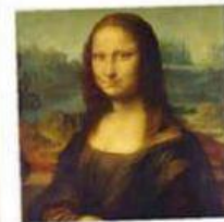
LA J OCONDE