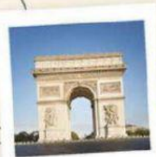
L' A RC DE TRIOMPHE