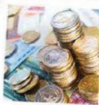
L' E URO