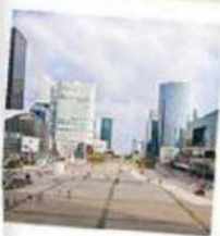
LA D ÉFENSE