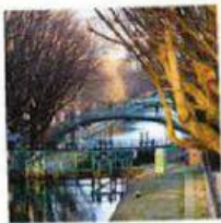
LE C ANAL SAINT-MARTIN