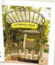
UNE B OUCHE DE MÉTRO