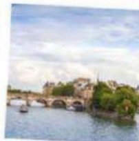
L' I LE DE LA CITÉ