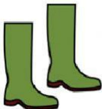
BOTAS DE AGUA