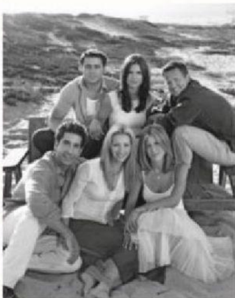
Protagonistas de la serie Friends (David Crane, Marta Kauffman), Warner Bros, 1994-2004