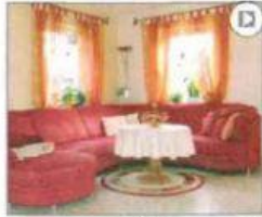
die Couch (das Sofa) im Wohnzimmer