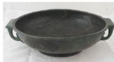
Леканида с похлупак

б) В текстовите полета напишете за какво са служили въпросните съдове