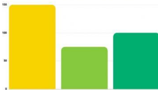
GRAFIK Menu Favourite Siswa

Berdasarkan hasil observasi dan pendataan yang dilakukan oleh pengelola resto diperoleh informasi bahwa ternyata ada beberapa menu yang kurang diminati oleh siswa sehingga seringkali ditemukan beberapa siswa tidak mau makan atau makanan tidak dihabiskan kemudian dibuang. Menyikapi hal tersebut pengelola mengadakan survey kepuasan pelanggan terkait menu yang disajikan. Berikut adalah grafik menu favourite dan tidak disukai siswa yang berhasil dihimpun oleh pengelola.