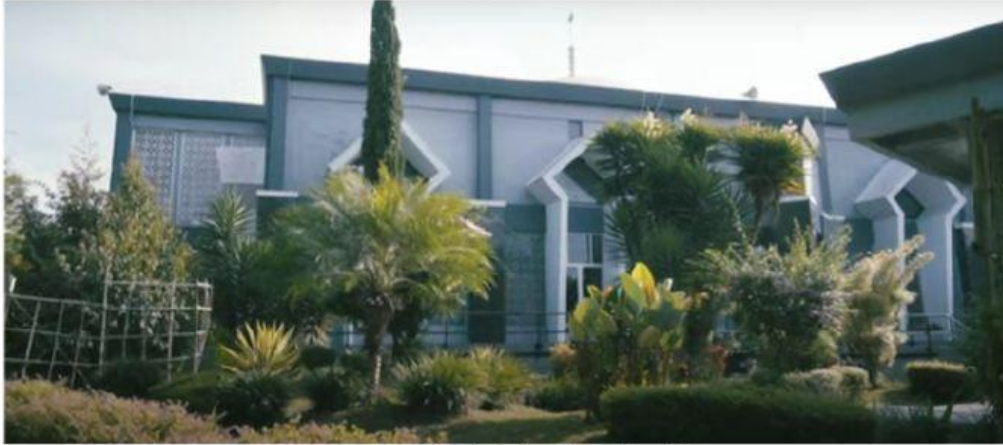
Doc. Masjid Sholahuddin Al-Ayubi