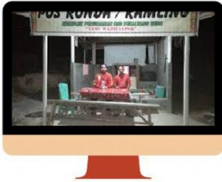
Gambar 3: Ronda Malam