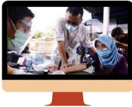
Gambar 4: Periksa Kesehatan