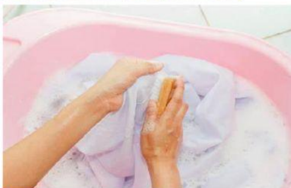
A. Merendam baju dengan air sabun

Apa yang harus dilakukan untuk membersihkan baju kotor ?