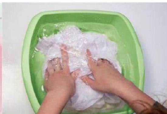
B. Merendam Baju dengan air biasa