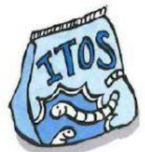
GUSANITOS 45 céntimos