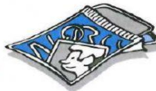
CROMOS 52 céntimos