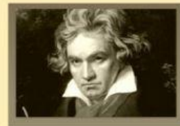
Beethoven in Bonn 16. 12. 1770

ist am elften zwölften zweitausendeins geboren