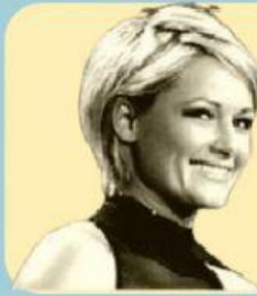
Helene Fischer in Russland 5.8.1984

ist am fünfzehnten zweiten neunzehnhundertachtundneunzig geboren