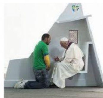
SACRAMENTO DEL PERDÓN