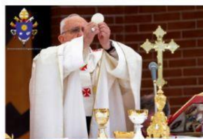
SACRAMENTO DE LA EUCARISTÍA