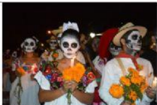
El día de los muertos en México