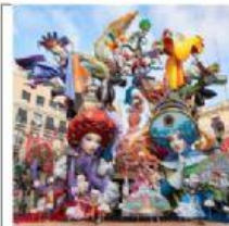
Las Fallas de Valencia