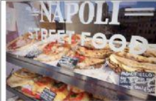
El arte de los pizzeros napolitanos