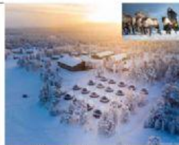
Región de Laponia