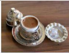
El café turco