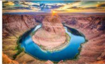
Parque nacional del Gran Cañón