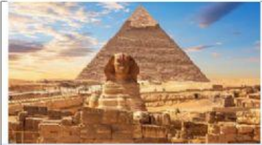
Pirámides de Guiza