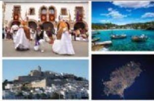
Isla de Ibiza, biodiversidad y cultura