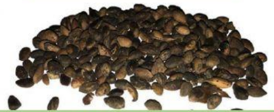
Semillas que necesitan tratamientos

Se les añaden sustancias químicas para evitar hongos y enfermedades