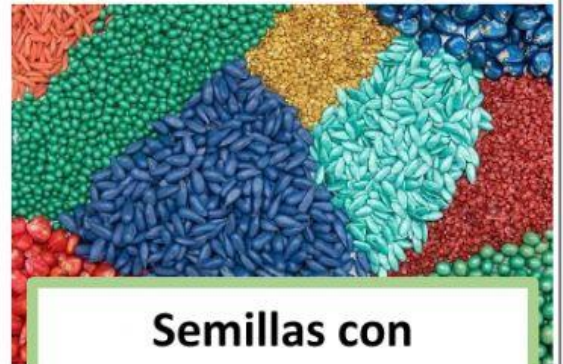
Semillas con cubiertas artificiales

Si les damos buenas condiciones, germinan sin problemas.